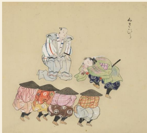
右：能狂言図巻（神戸女子大学図書館蔵）「道成寺」