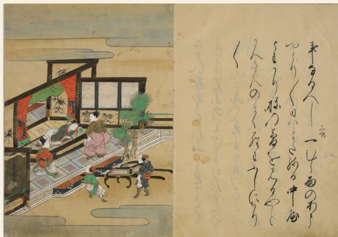
左：絵入謡本（神戸女子大学古典芸能研究センター蔵）「邯鄲」