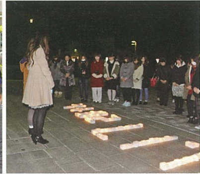
キャンドルナイト(家政学科) 1.17 20thの灯りの前で参加者が黙とう