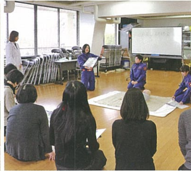
AEDの使用説明をする学生消防団員