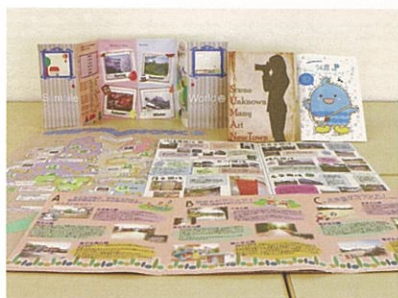
学生が作ったオリジナルのリーフレット

完成までの過程では、授業のたびに研究・調査の成果を発表し、お互いのグループの作品を見て批評しあいました。学生たちは、他のグループの意見を取り入れることがよい結果につながることを認識し、提案力と企画力が身についたと語っています。将来はデベロッパーに就職することを目指す学生もでてきました。