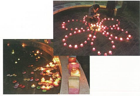
キャンドルナイトで飾られたろうそく

阪神・淡路大震災と東日本大震災なども併せた多くの犠牲者への追悼とご冥福をお祈りするとともに、神戸の地で学ぶ学生たちに生命の尊さを伝え、防災意識の向上を図り、健康で安全に生きることの大切さを再確認する機会となりました。