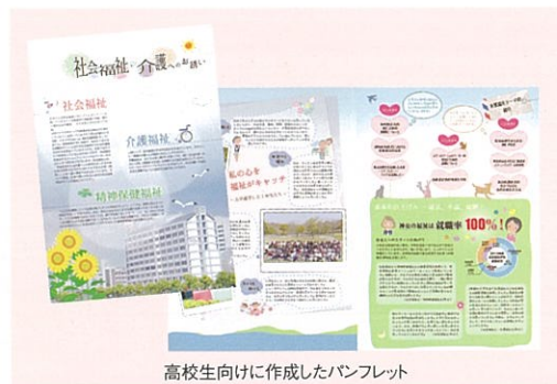
高校生向けに作成したパンフレット