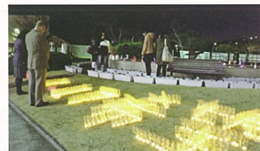
キャンドルナイトの様子(学友会)