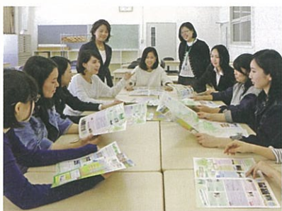
須磨区役所発行のリーフレットを見て自分たちのアイデアが生かされたことを確認