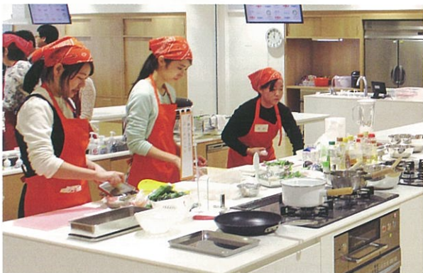
たまご甲子園:調理に奮闘中の学生

ビタミンB群に属する水溶性ビタミン。血をつくる働きに関係し、不足すると貧血になることもある。元気な赤ちゃんを産むために大切な栄養素であり、また妊娠を望んでいる女性や妊娠中の女性は、妊娠前から妊娠初期にかけて1日の葉酸摂取量=480 \mu g(マイクログラム)以上摂取することで胎児の神経管閉鎖障害の発症リスクを低下させるとされている。体内に蓄えることが難しく、毎日摂取することが大切。緑黄色野菜、果物、レバーなどに多く含まれている。