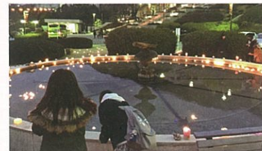
キャンドルの灯りがとる噴水(家政学科)