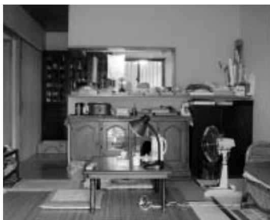
写真2．居間から対面式キッチンを見る