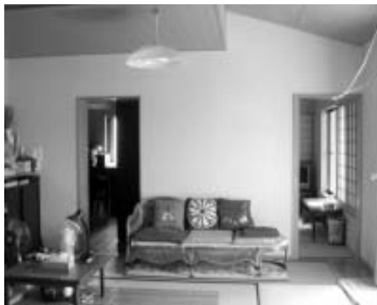
写真1．居間から夫の部屋，妻の納戸を見る

日中，主に居る場所である。この部屋での生活行為としては食事，休息，昼寝，テレビを見る，洗濯物の整理等の家事，読書，勉強（英語，パソコン）などをあげ，自立した生活を楽しむ様子が伺えた。冬はこたつとなるテーブルを長年使用し，これを食事用テーブルとしている。設計時には椅子座の生活を勧めたが，食事を含む居間の生活に椅子座は受け入れてもらえなかった。対面式キッチンのカウンター下に棚が置いてある。これは妻が定位置に座ったときの背もたれとなり，日常よく使う物の収納に便利で都合が良いようだ。扇風機をこたつテーブルの横に置いて使っている。エアコンの長時間使用は気分が悪くなるため室内が30度を超える暑さの時に短時間使うだけで，扇風機の方がよく使うそうだ。壁に沿って置かれているソファはよこになれる大型サイズのもので，時々，夫の昼寝に使われる。