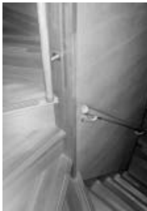
写真4. 階段の手すり

居住者2人は、この6.5年の間に住宅内でのつまずきや転倒によるケガを経験していないので、段差と手すりと滑りにくい床材に関する配慮は新築から調査時点までは適当であったと言えるようだ。基本生活空間を配置した1階部分の屋内は、玄関の上がり框と浴室出入口を除い