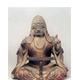
比叡山延暦寺の維摩居士坐像

仏教の經典と言えば難しそうに感じますが、經典文学といわれる「物語のようなお話」になっているものも少なくありません。そのひとつ、<さとりの真髓を伝える最高傑作『維摩経』を、用語を一つ一つ丁寧に解説しながら「仏教入門書」として読んでみましょう。