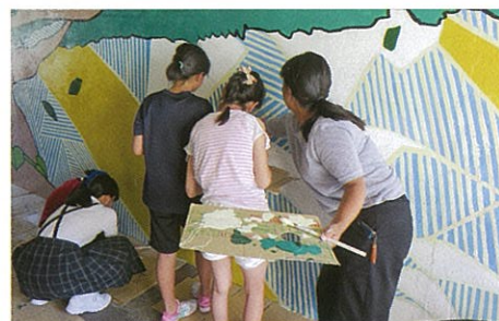
最後の仕上げをするイラスト部の学生

イラスト部と美術部の学生たちは一緒に活動を始めて、お互いが刺激して知識や技術を学び合え、自分たちの活動で地域に貢献できたことを大変嬉しく感じ、今後も絵を描くことで地域貢献をしていく決意を固めていました。