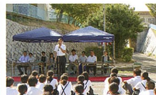
高倉中学校前で行われた除幕式の様子