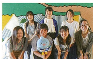
協力したイラスト部と美術部の学生、除幕式後に壁画の前で記念撮影