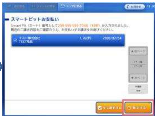
お支払いになる請求情報の選択 (タッチ) が完了したら「確定する」ボタンを押してください。