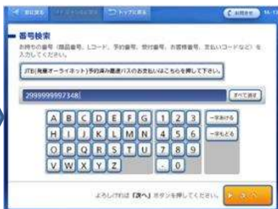
「スマートピット番号 (13桁)」の入力後「次へ」ボタンを押してください。