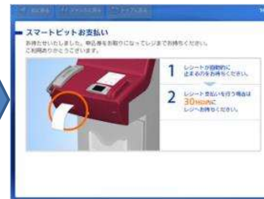
申込券が発券されますので、申込券をお取りになり「スマートピットお支払い申込券」と印字されていることをご確認の上、レジでお支払いください。