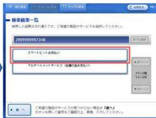
サービスが2件表示されますので「スマートピットお支払い」を選択してください。