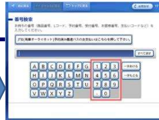
番号検索画面にて「スマートピット番号 (13桁)」を入力してください。