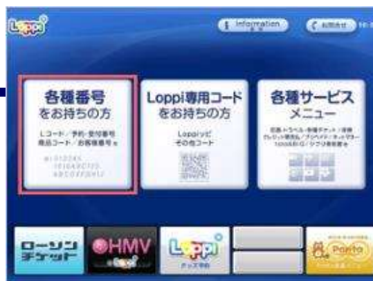
Loppi画面より「各種番号をお持ちの方」を選択してください。