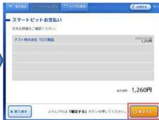
選択した請求情報を再度ご確認の上、「確定する」ボタンを押してください。