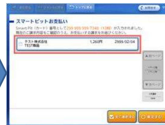
ご請求の情報が表示されます。お支払いになる請求情報を選択 (タッチ) してください。