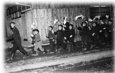
キツネガリ 多可郡多可町中区 (1961年)