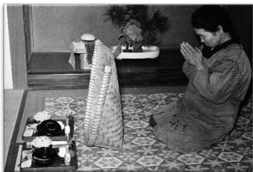
ヤマドッサンを祀る 淡路市野島轟木 (1966年)

今回は、この本の論拠に挙げられた写真を中心に、兵庫県各地の四季折々の行事や懐かしい風物の写真を展示します。この展示が、私たちの生活のリズムの根っこにあるものを見直し、地域に根ざした未来を展望する機会となることを願っております。どうぞゆっくりとご覧ください。