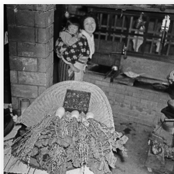
秋亥の子の供え物 三木市吉川町 (1955年)