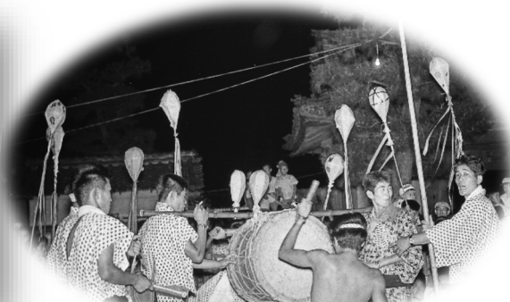
サイレンボウズ たつの市揖西町 恩徳寺 (1965年)