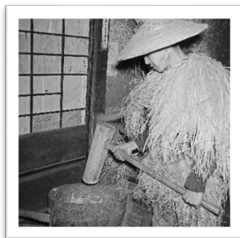
ヤマドッサンを迎える準備 淡路市舟木 (1955年)