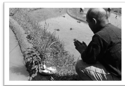
田植祭 淡路市野島常盤 (1960年)

※やむを得ず中止する場合がございます。最新情報はホームページでお知らせしますが、念のため事前にお問い合わせください。